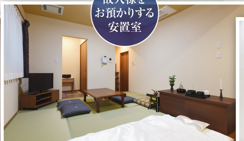
故人様を お預かりする 安置室